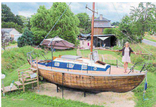
Catherine Saint-James sur le diskiant , près de la maison éclusière.

Pour 75 €, on peut y passer la nuit mais aussi profiter d'un petit-déjeuner, à bord ou sur la table du pont. Un bloc sanitaire neuf, une cuisine d'été